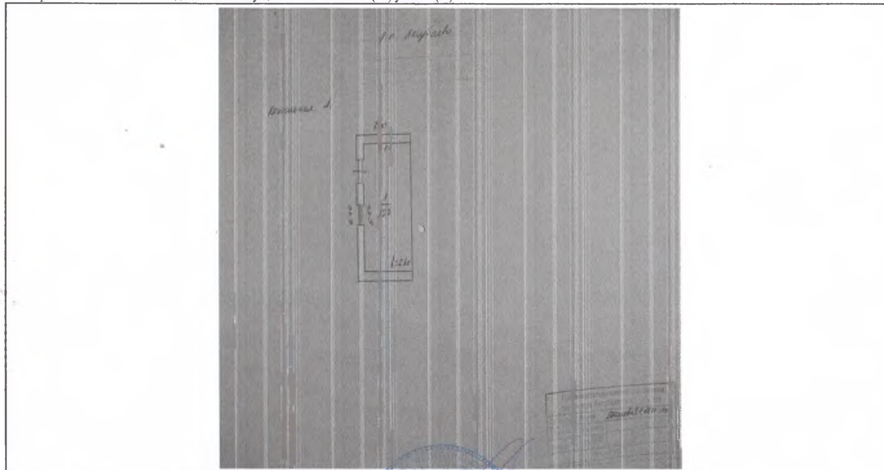
Схема расположения объекта недвижимого имущества на земельном(ых) участке(ах):